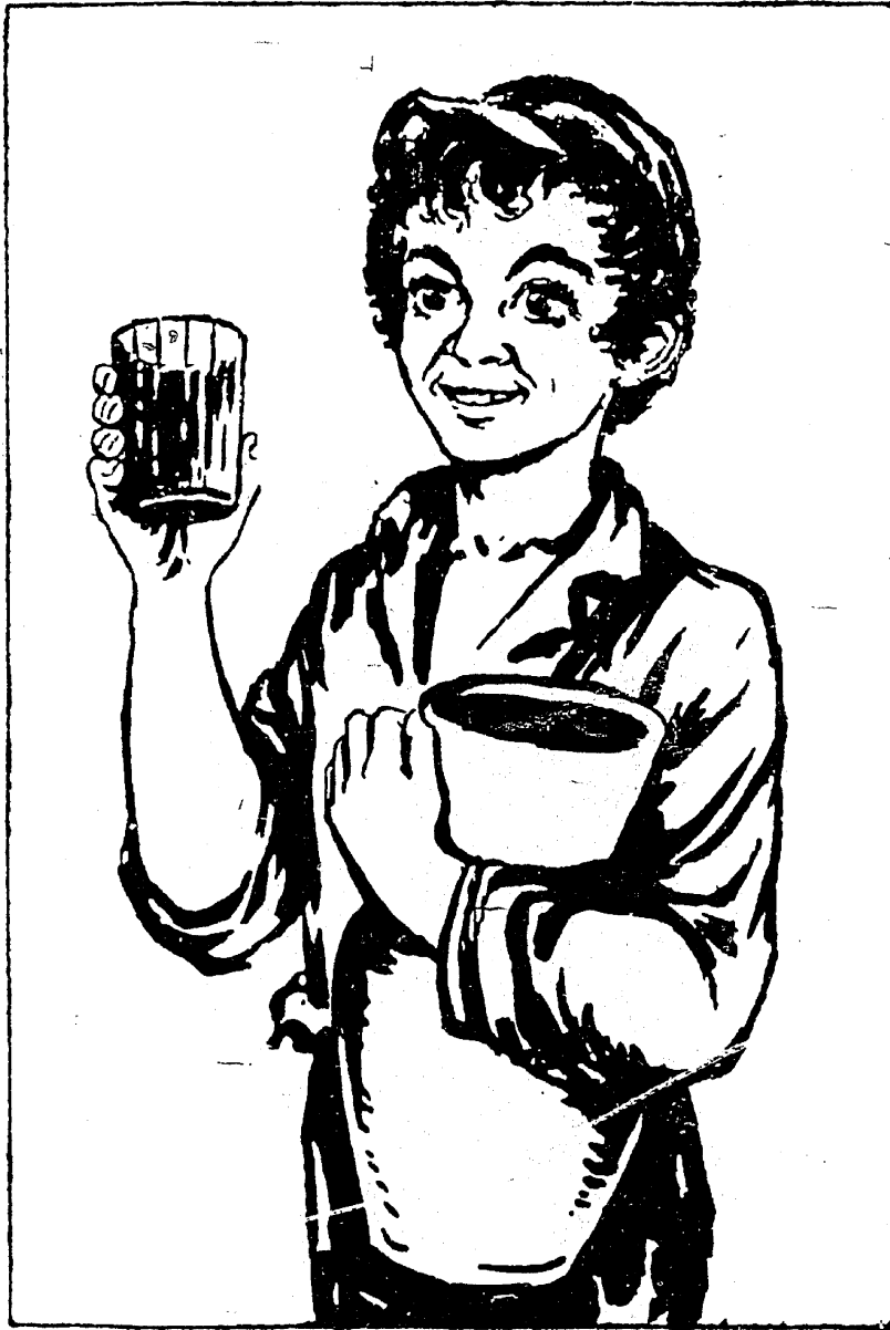
וְיִסַּד קוֹמָא & לֵאמָר & קְדַמְתָּ & יְדִי...